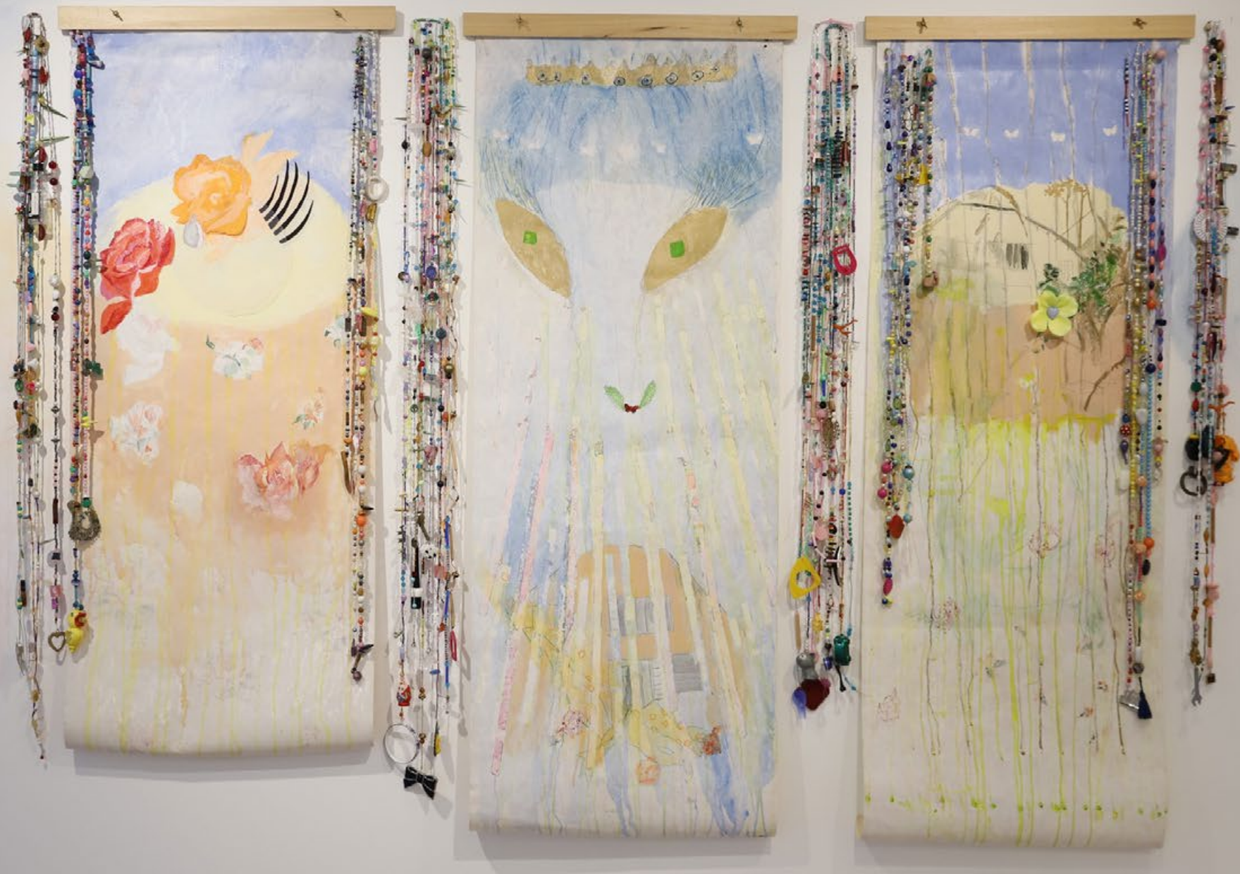
Tríptico técnica mixta 220 x 150 cm 2019