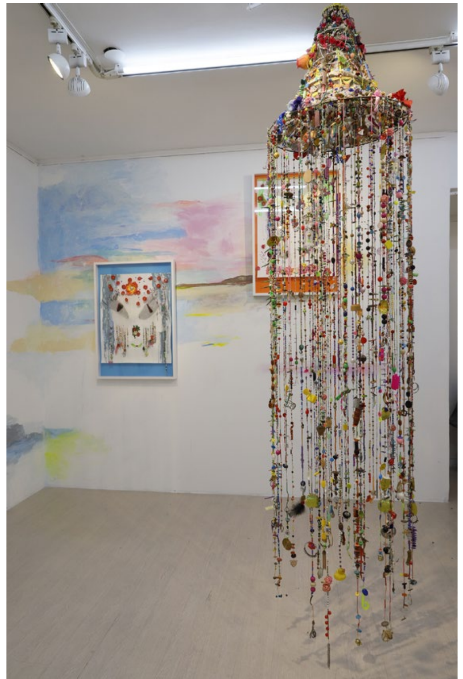
Capilla Técnica mixta 260 x 60 cm 2019