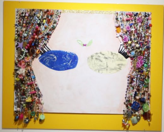
Despertar de deva del rio al mar Técnica mixta 70 x 100 cm 2019