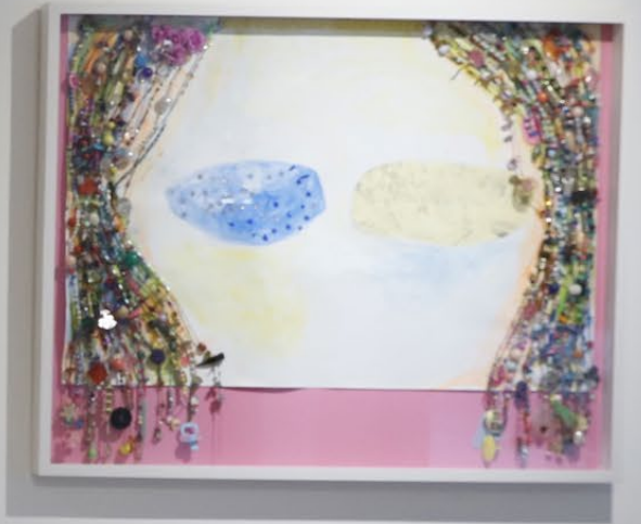
Despertar de Deva Técnica mixta 70 x 100 cm 2019