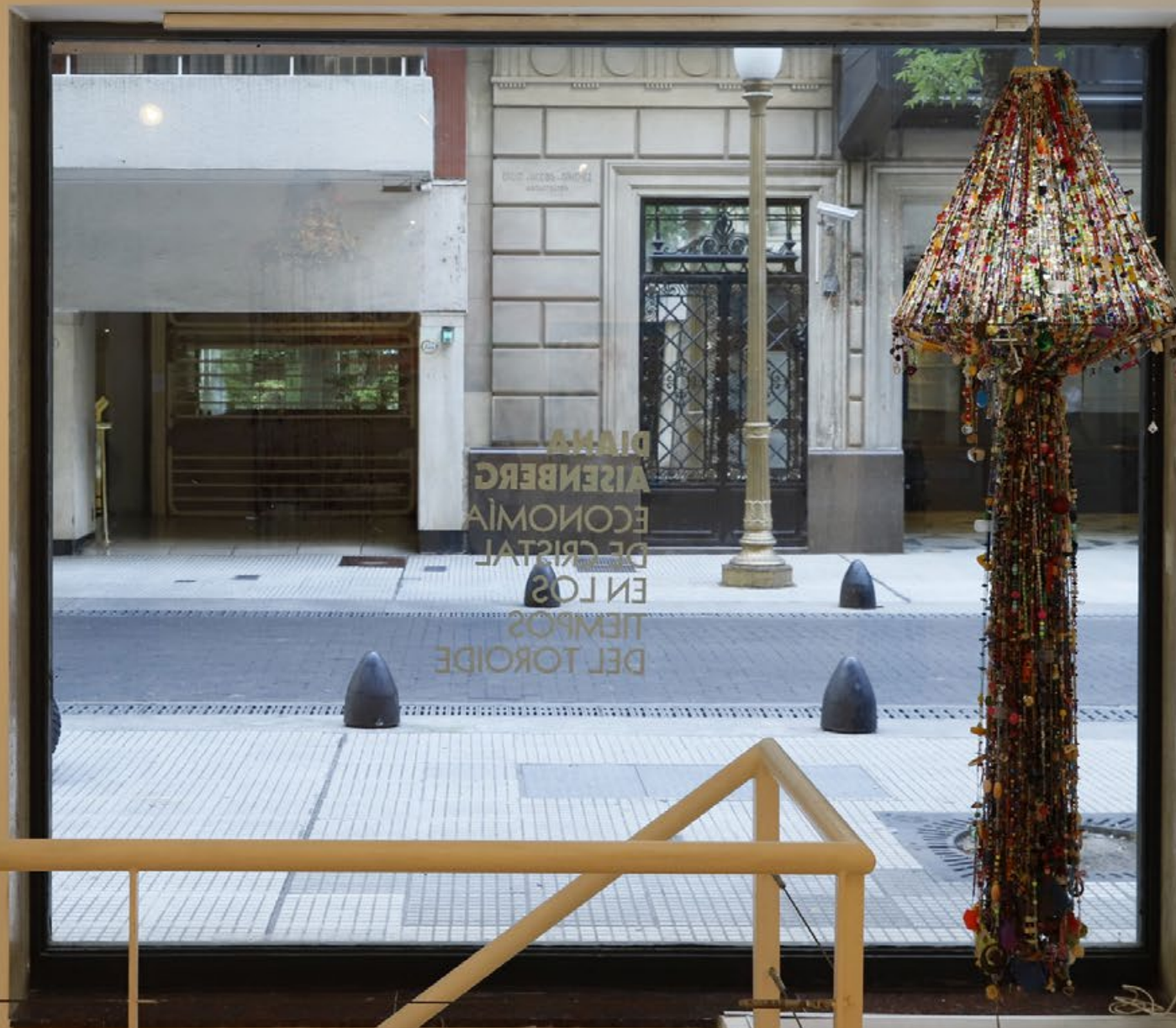
Hongo Técnica mixta 220x600 cm 2019