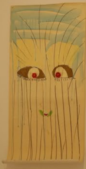
Indio Técnica mixta 113 x 53 cm 2019